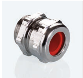
Abb. 1 Fig. 1