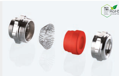
Abb. 2 Fig. 2