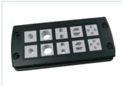
CF10/24 mit Kreuzgitter, Doppelkreuzgitter und Einfachsteg sowie zehn kleine Dichteinsätzen