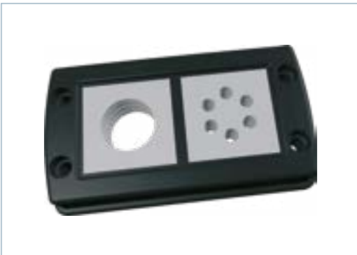
CF8/16 mit Einfachsteg und zwei großen Dichteinsätzen