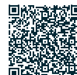
Abb. 1 – PFLITSCH Produktsuche – Produktauswahl treffen und individuelles Angebot anfordern Fig. 1 – PFLITSCH Product Search – select a product or products and request a quotation