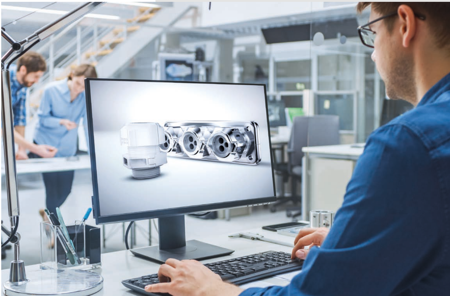
Abb. 1 – Per Mausklick auf den PFLITSCH CAD-Bauteilekatalog zu- greifen Fig. 1 – Click your way through the PFLITSCH CAD component cata- logue

Everything from a single source – from consulting to customised product solutions